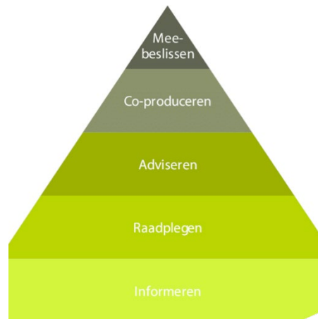
Figuur 1 participatieniveau's

onderstaande figuur 1. Bij geconsulteerden en toehoorders gaat het om informeren en raadplegen. Bij de adviseurs en partners gaat het om adviseren en co-produceren. Elke groep stakeholders heeft een eigen participatieniveau toebedeeld gekregen voor dit project (zie KVPm.e.r. H6).