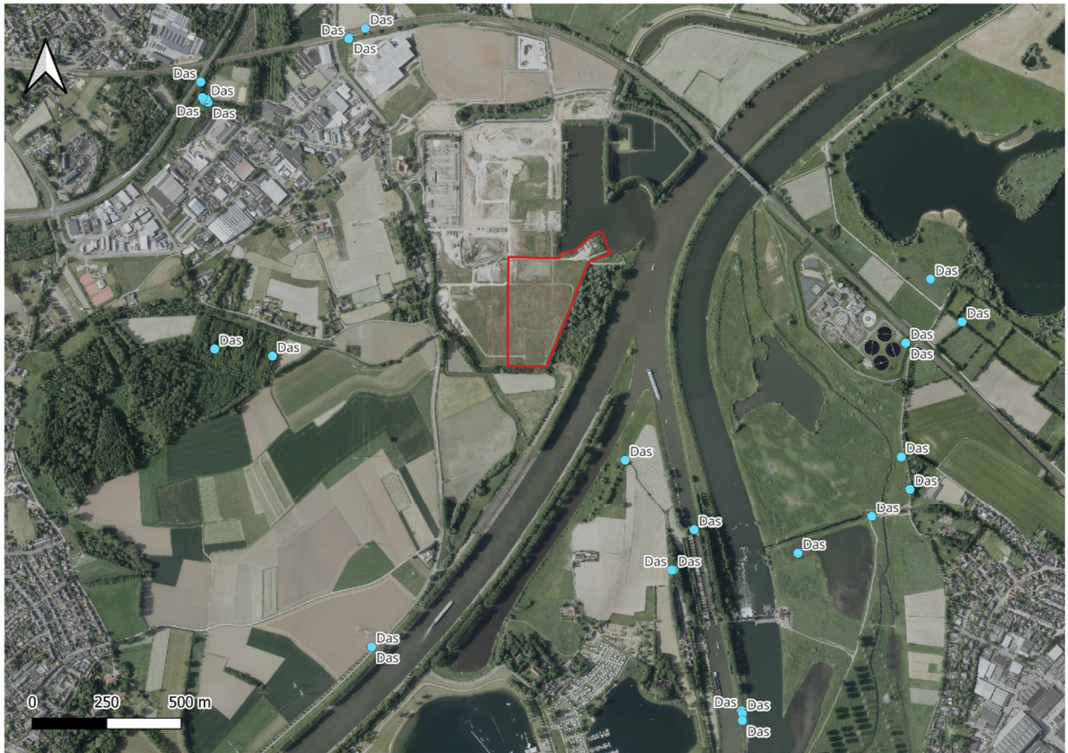
Abbeelding 8. Verspreiding van de das rond het plangebied (Rood omlijnd). Verspreidingsdata: NDFP; luchtfoto: PDOK.

Uit de literatuurstudie zijn geen andere beschermde marterachtigen naar voren gekomen. Voor kleine marterachtigen kan omliggende gebied geschikt zijn. Echter, het plangebied zelf biedt vanwege de openheid en het intensieve beheer geen geschikt habitat voor deze soorten. Gezien de afwezigheid van geschikte wateren binnen het plangebied is de aanwezigheid van otter op voorhand uit te sluiten.