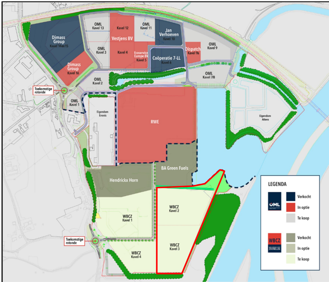
Afbeelding 2. Plattegrond Zevenellen.

Bedrijventerrein Zevenellen ligt in de driehoek tussen de Roermondseweg/Zevenellenweg te Leudal (westzijde), de spoorlijn Roermond-Weert (noordoosten) en de Maas/Lateraalkanaal (oostzijde) en bestrijkt een oppervlakte van in totaal circa 84 hectare.