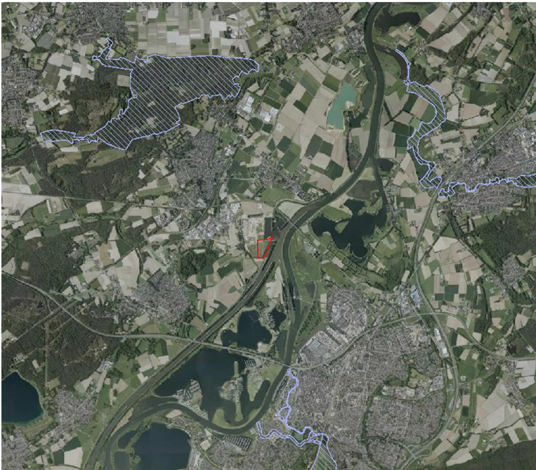
Afbeelding 11. Ligging van het plangebied (rood omlijnd) ten opzichte van de dichtstbijzijnde Natura 2000 gebieden (blauw gearceerd). (Bron luchtfoto: PDOK).

Het plangebied ligt niet binnen de grenzen van een Natura 2000-gebied. Wel zijn er binnen een straal van 4 kilometer drie Natura 2000 gebieden gelegen. Dit zijn de gebieden Roerdal (2,7km), Leudal (3km) en Swaldal (3,6km). In afbeelding 11 is de ligging van het plangebied ten opzichte van de Natura 2000-gebieden weergegeven.