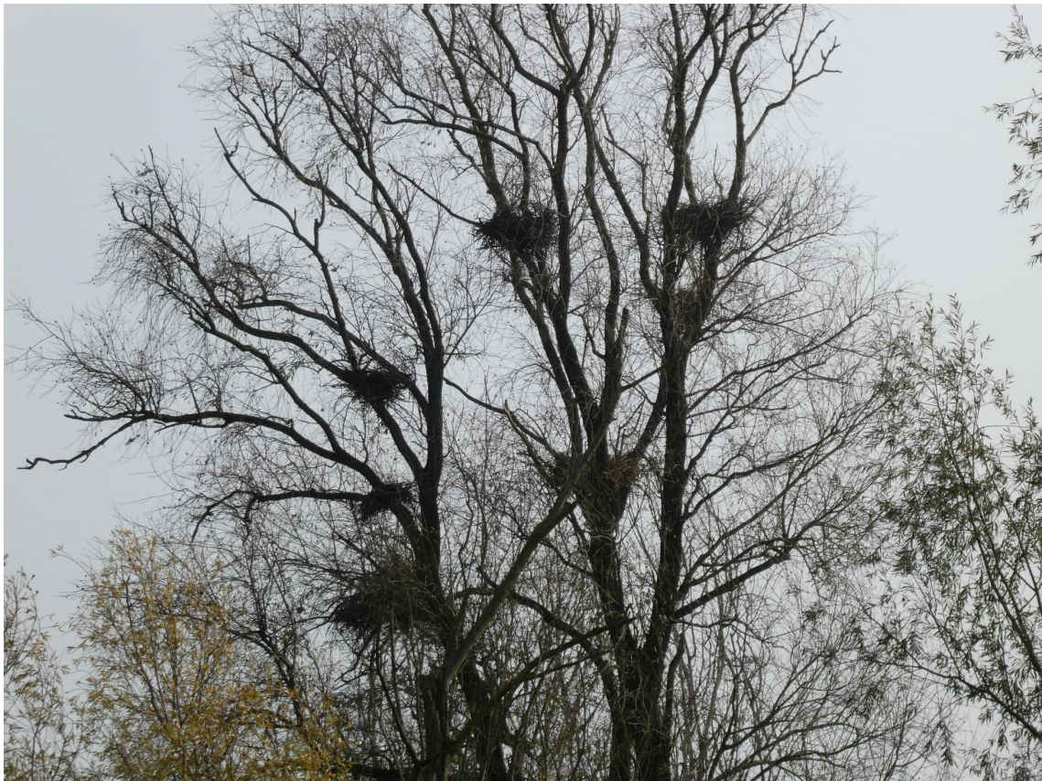
Afbeelding 4. Boom in het bos aan de oostelijke zijde van het plangebied met meerdere grote nesten.

Uit het literatuuronderzoek is gebleken dat er 6 omgevingsscansoorten rond het plangebied zijn aangetroffen, namelijk: blauwe reiger, buizerd, ijsvogel, spotvogel en visdief. Tijdens het veldbezoek is de buizerd rond het plangebied aangetroffen. Deze vloog op uit een boom aan de noordelijke zijde van het plangebied. Op de betreffende plek of elders in de nabijheid is geen nest van de buizerd aangetroffen. Aangrenzend aan het plangebied zijn een aantal bomen aangetroffen waarin de nesten zijn aangetroffen van de blauwe reiger (afbeelding 4). Deze soort is tijdens het veldbezoek ook gehoord in de omgeving. Uit het literatuuronderzoek blijkt dat daar een kolonie blauwe reigers voorkomt. Overige omgevingsscansoorten of nesten hiervan zijn niet aangetroffen.