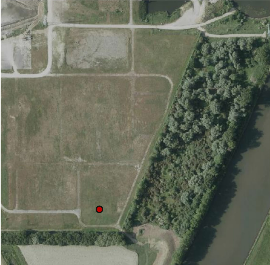
Afbeelding 6. Locatie waar een konijnenhol met 3 ingangen is aangetroffen.