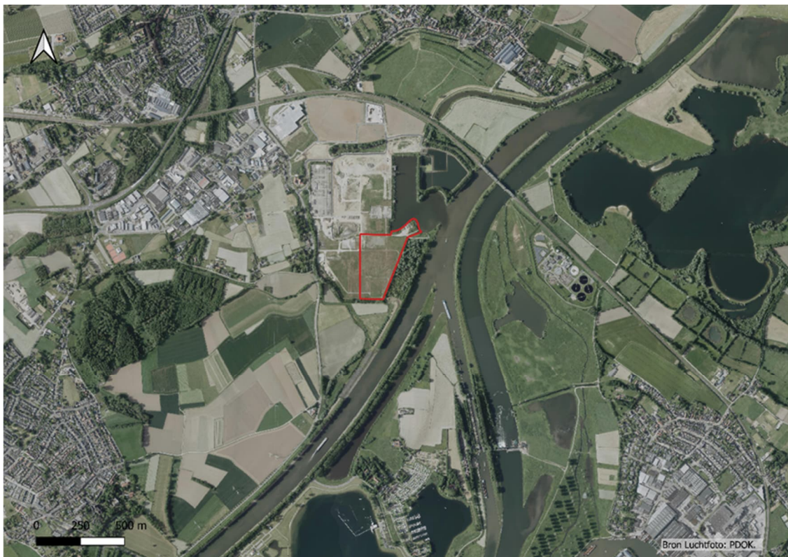
Afbeelding 1. Overzichtskaart van het plangebied (rood aangegeven) te Haelen.

Het projectgebied ligt op het bedrijfsterrein Zevenellen te Haelen in de gemeente Leudal. In afbeelding 1 is het plangebied weergegeven.