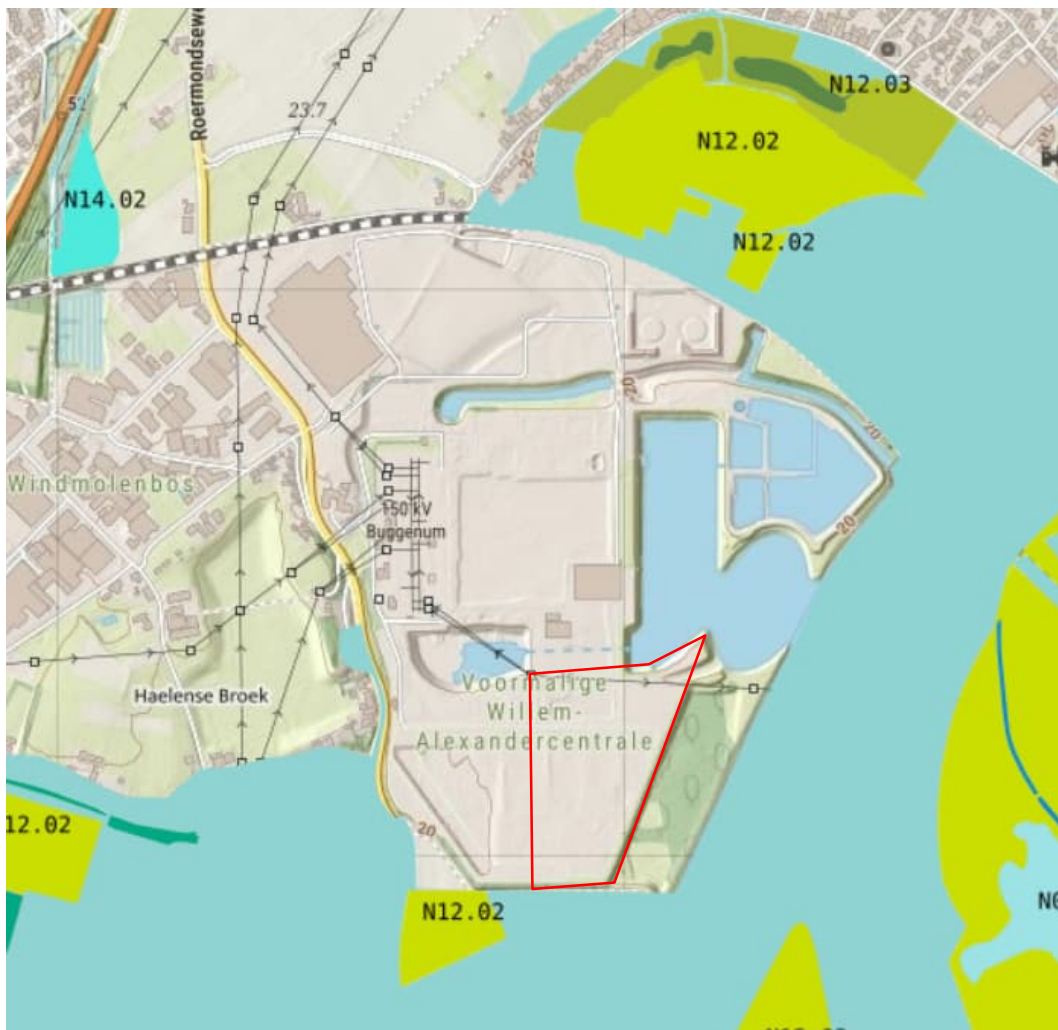
Afbeelding 12. Natuurnetwerk Limburg (groene arcering met nummer beheertype) en de groenblauwe mantel (blauw gearceerd) in relatie tot het plangebied.

Er zijn binnen de grenzen van het plangebied geen gebieden van het Natuurnetwerk Limburg (Goudgroene natuurzone) of onderdelen van de Groenblauwe mantel (voorheen Zilvergroene natuurzone of Bronsgroene natuurzone) aanwezig. De dichtstbijzijnde gebieden betreffen een gebied direct ten zuiden van het plangebied, dit maakt onderdeel van het Natuurnetwerk Limburg (NNL) en het lateraal kanaal Linne-Buggenum, wat onderdeel is van de Groenblauwe mantel. Binnen de provincie Limburg geldt dat externe werking niet van toepassing is zolang er geen sprake is van oppervlakte aantasting van het NNL. In de voorgenomen plannen wordt het oppervlak van NNL niet aangetast en er is daarom geen sprake van externe werking. Afbeelding 12 laat de ligging van het plangebied ten opzichte van de NNL gebieden en verschillende landschapszones.