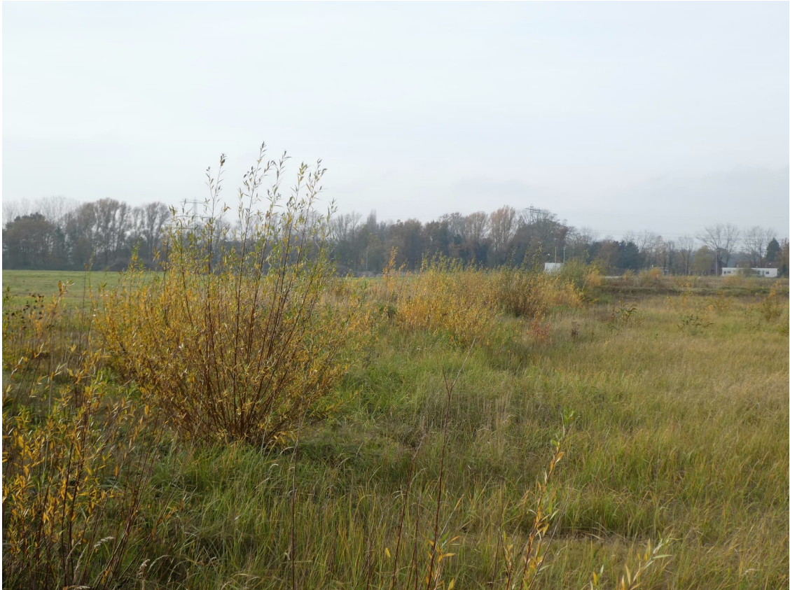
Afbeelding 5. Houtachtige planten aan de noordelijke zijde van het plangebied die potentieel geschikt kunnen worden voor vogels.

In het noordelijke deel van het plangebied is een verhoging aanwezig waar tijdens het veldbezoek beginnende struweelvorming optreedt. Deze planten kunnen mogelijk door algemeen voorkomende broedvogels gebruikt worden als nestplaats. Op afbeelding 5 is de struweelvorming binnen het plangebied te zien. In het gebied rond het plangebied zijn veel geschikte plaatsen die gebruikt kunnen worden als nest en foerageergebied voor algemeen voorkomende broedvogels. Hierdoor vervult het plangebied geen essentiële functie voor soorten van deze groep.