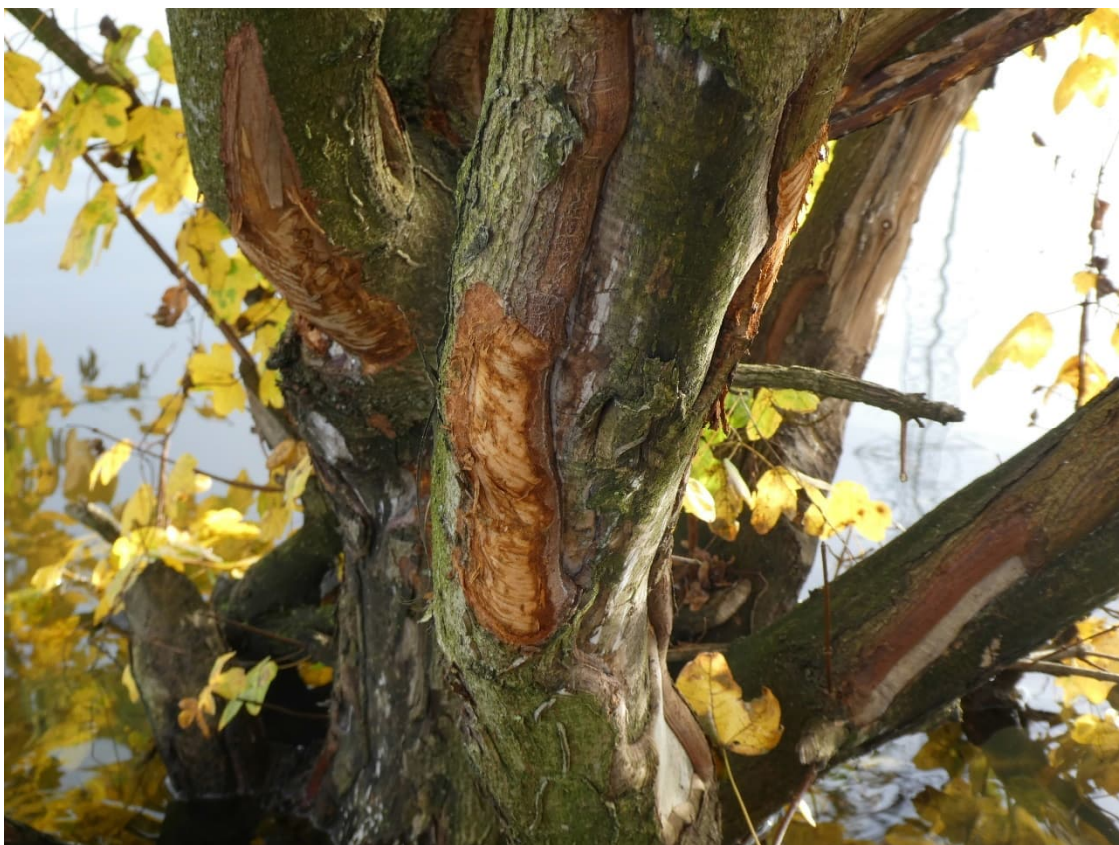
Afbeelding 7. Vraatsporen van de bever aan de noordelijke zijde van het plangebied.

Uit de literatuurstudie is gebleken dat de eekhoorn rond het plangebied is waargenomen. Deze soort is tijdens het veldbezoek niet aangetroffen. Daarnaast zijn er ook geen sporen van de eekhoorn gevonden binnen het plangebied. Binnen het plangebied is geen geschikt habitat voor deze soort aanwezig. Er is geen (oud) bos aanwezig binnen het plangebied waar de eekhoorn gebruik van kan maken als foerageergebied en nestgelegenheid. Hierdoor is uitgesloten dat deze soort gebruik maakt van het plangebied.