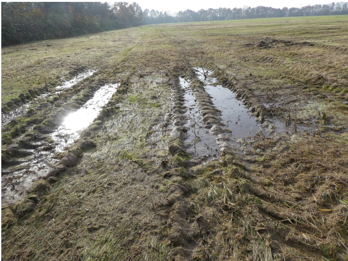
Afbeelding 9. Een van de rijsporen waar water in staat die door de rugstreepad gebruikt kan worden.