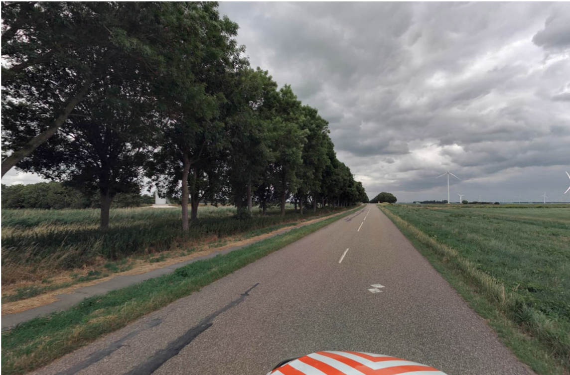
Figuur 1 Overzicht inrichting Ibisweg ter hoogte van het plangebied

De provinciale N-wegen in het gebied (N705 en N706) zijn gebiedsontsluitingswegen buiten de bebouwde kom en hebben een maximumsnelheid van 80 km/u. De capaciteit van deze wegen ligt tussen de 6.000 en 20.000 mvt/etmaal. Hier zijn naast de rijbanen vrijliggende dubbelfietspaden aanwezig en zijn er weinig zijwegen en erfontsluitingen. Dit maakt dat deze N-wegen rond de 10.000 mvt/etmaal vlot en veilig zouden moeten kunnen verwerken.