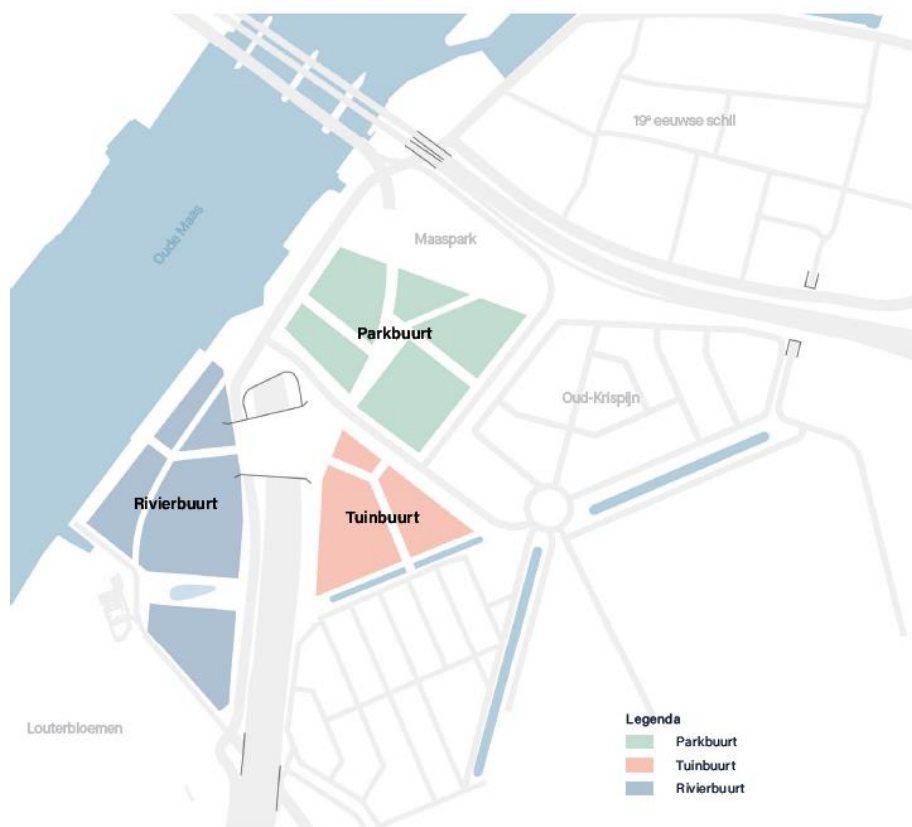
Afbeelding uit het Masterplan Maasterras met fase 1 (Parkbuurt en Tuinbuurt) en fase 2 Rivierbuurt

De ontwikkeling van het Maasterras is te groot om in één keer tot ontwikkeling te brengen. Daarom is gekozen voor een gefaseerde ontwikkeling. Voor het gehele Maasterras is één stedenbouwkundig masterplan gemaakt (hierna Masterplan). Dit voorliggende bestemmingsplan is opgesteld voor fase 1. Dat betreft het gebied ten oosten van de A16; de deelgebieden Parkbuurt, Tuinbuurt en het Maaspark zoals aangegeven op onderstaand kaartje. In fase 1 worden maximaal 3.000 woningen gebouwd en is ruimte voor circa 23.000 m 2 aan voorzieningen.