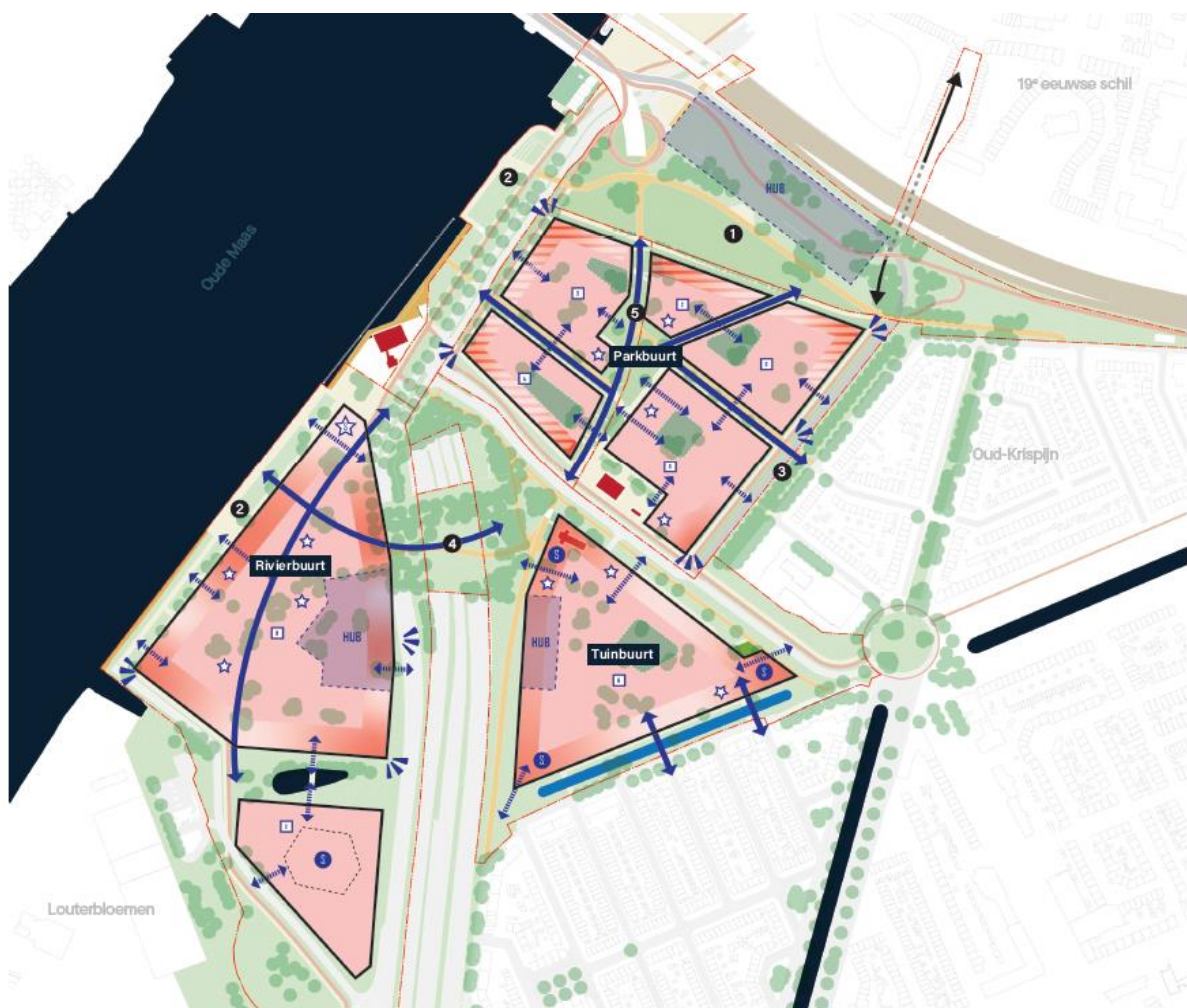
Afbeelding stedenbouwkundig raamwerk uit het Masterplan

In het Stedenbouwkundig Masterplan Maasterras (verder te noemen het Masterplan) wordt de toekomstige ontwikkeling van het Maasterras beschreven. De komende jaren transformeert het Maasterras van een bedrijventerrein tot een levendige gemengde stadswijk waar gewoond, gewerkt en gerecreëerd wordt. Er wordt ingezet op 2.200 woningen in de eerste fase.