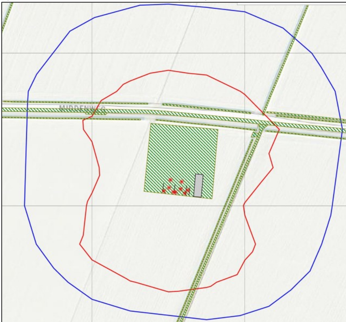
Figuur 1.1 Geluidcontour rood = 50 dB Letmaal, blauw = vastgestelde geluidzone

Tevens is de geluidcontour voor L_{etmaal}=50\text{dB(A)} bepaald, zie Figuur 1.1 en Bijlage 4. Deze contour valt in zijn geheel binnen de vastgestelde geluidzone.