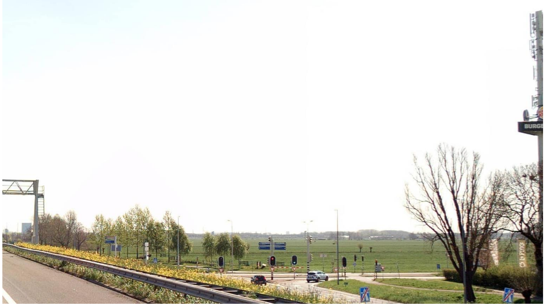
Figuur 2 Locatie A bestaande situatie