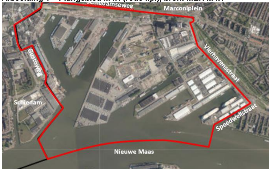
Afbeelding 1 Plangebied M4H (rode lijn)

Het plangebied bestaat uit vier te ontwikkelen deelgebieden: Galileipark, Marconikwartier, Keilekwartier en Merwehaven, zie onderstaande afbeelding. In de deelgebieden Gustoweg, FTR (Fruit Terminal) en Vierhavens blijven voorsnog de huidige bedrijfsactiviteiten gevestigd. Als gevolg van onder andere het akoestisch klimaat, worden in het voorkeursalternatief (VKA) alleen een gedeelte van de Merwehaven verder ontwikkeld.