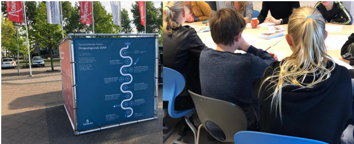
Afbeeldingen: Verschillende vormen van participatie tijdens het proces om te komen tot de deelvisie Julianadorp

Op 21 april 2022 zijn in het wijkplatform Julianadorp enkele kleine actualisatiepunten voor de deelvisie Julianadorp gepresenteerd. Deze punten zijn meegenomen in de actualisatie van de deelvisie. De actualisatie is eind oktober 2022 toegelicht aan geïnteresseerden.