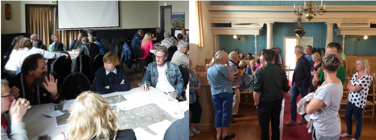
Afbeeldingen: Beelden uit de vier participatiebijeenkomsten in Huisduinen

Het resultaat van de concept-visie zoals opgesteld door bewoners, ondernemers en andere betrokkenen is medio 2017 door henzelf gepresenteerd aan de raadscommissie. Na deze presentatie is de gemeenteraad tijdens een werksessie geconsulteerd, om te zien of er sprake was van (grote) strijdigheden. Toen hier geen sprake van bleek te zijn is de deelvisie Huisduinen als structuurvisie aan de gemeenteraad voorgelegd voor besluitvorming en in het voorjaar van 2018 als eerste onderdeel van de omgevingsvisie vastgesteld.