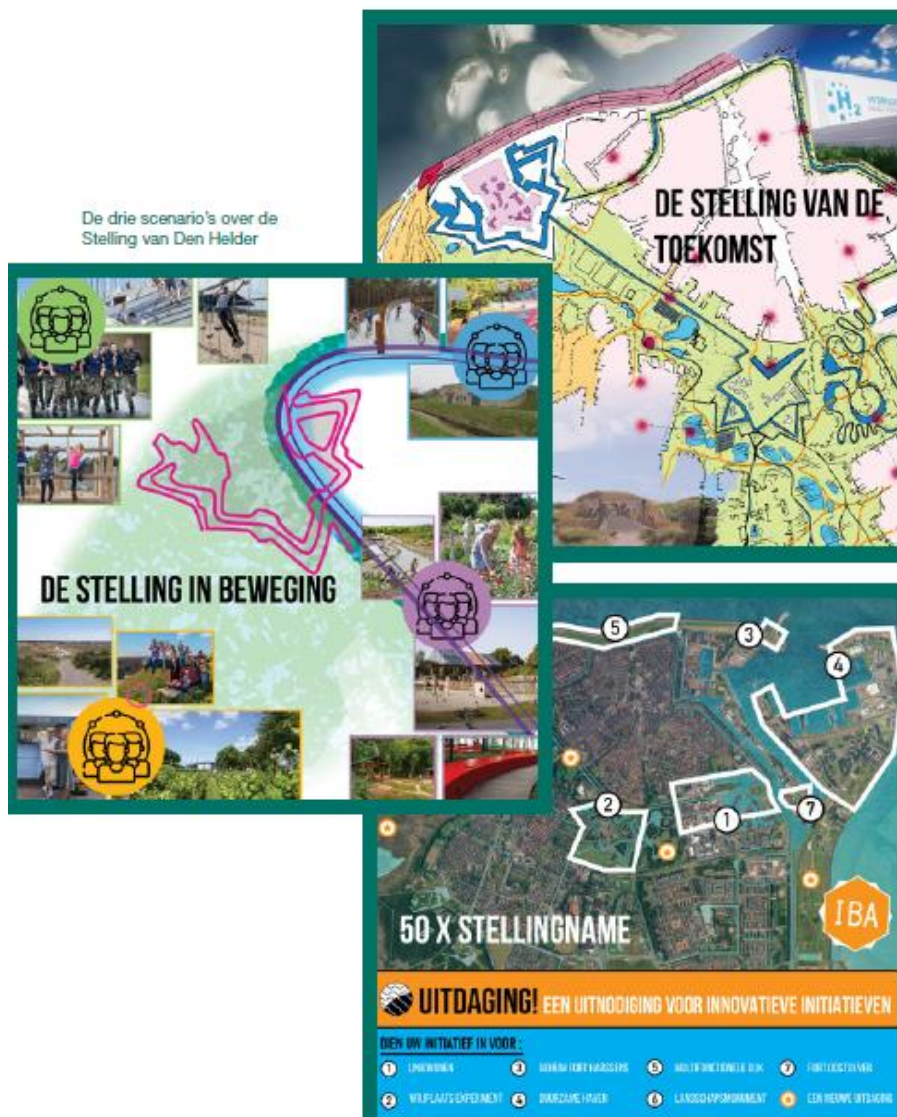
Afbeelding: De drie verschillende scenario's die de basis vormden voor de gesprekken

Tijdens 'de week van de Stelling' werden de bewoners via het online platform ingesprek.denhelder.nl ook gevraagd om mee te denken over deze scenario's. Dit leverde waardevolle discussies en aanscherpingen op. Zo schreef een bewoner: "Wat me aanspreekt in deze stelling is de aandacht voor klimaatverandering. Ik zou het krachtiger maken door het verdedigen tegen onszelf en onze eigen acties te noemen. Verdedigen tegen klimaatverandering, lijkt het net een probleem dat buiten onszelf staat. Terwijl wij naar mijn mening het probleem zijn en dus ook degenen die het tij kunnen keren."