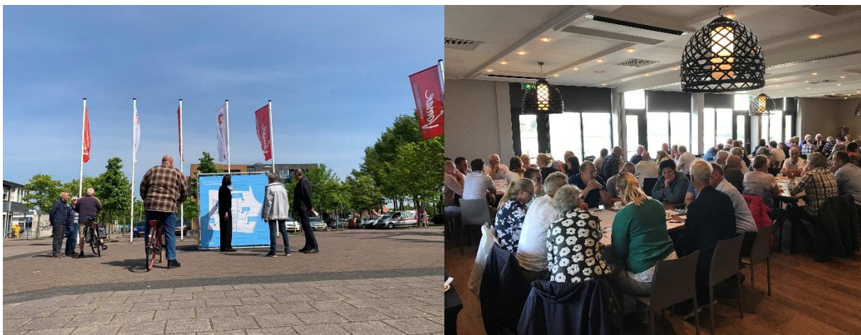
Afbeelding: Beelden uit het participatieproces bij de deelvisie Julianadorp

Als penvoerder heeft de gemeente deze inbreng in 2019 samengevoegd in een eerste concept, dat is besproken met de gemeenteraad en betrokkenen en is gepresenteerd tijdens een buitententoonstelling in Julianadorp. Eind 2019 is de deelvisie Julianadorp door de gemeenteraad vastgesteld als structuurvisie.