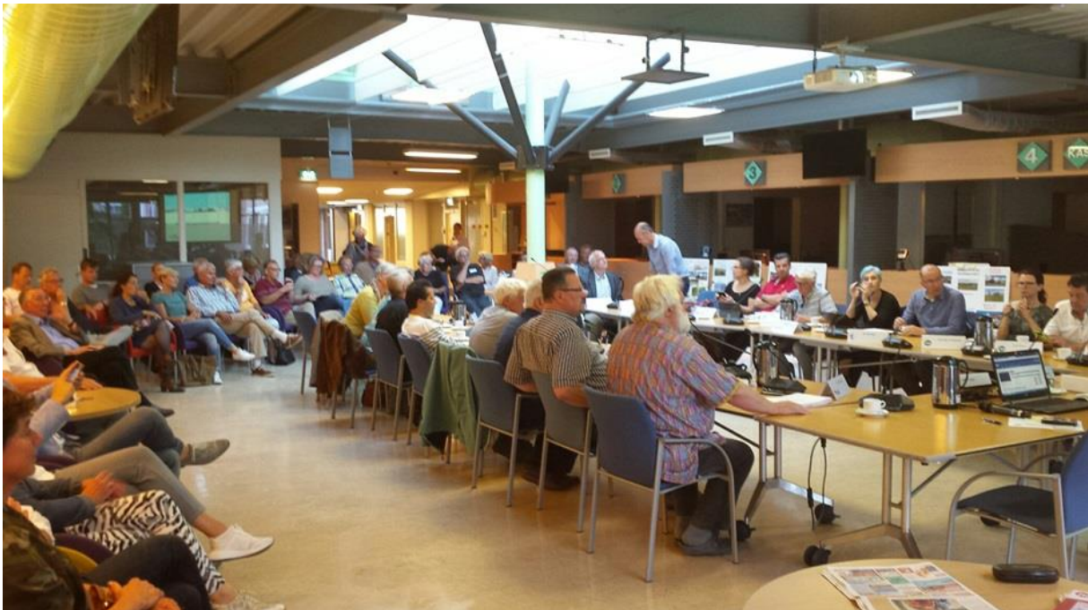
Afbeelding: Inwoners van Huisduinen presenteren de concept-visie op hun dorp aan de raadscommissie in 2017

Het resultaat van de concept-visie zoals opgesteld door bewoners, ondernemers en andere betrokkenen is medio 2017 door henzelf gepresenteerd aan de raadscommissie. Na deze presentatie is de gemeenteraad tijdens een werksessie geconsulteerd, om te zien of er sprake was van (grote) strijdigheden. Toen hier geen sprake van bleek te zijn is de deelvisie Huisduinen als structuurvisie aan de gemeenteraad voorgelegd voor besluitvorming en in het voorjaar van 2018 als eerste onderdeel van de omgevingsvisie vastgesteld.