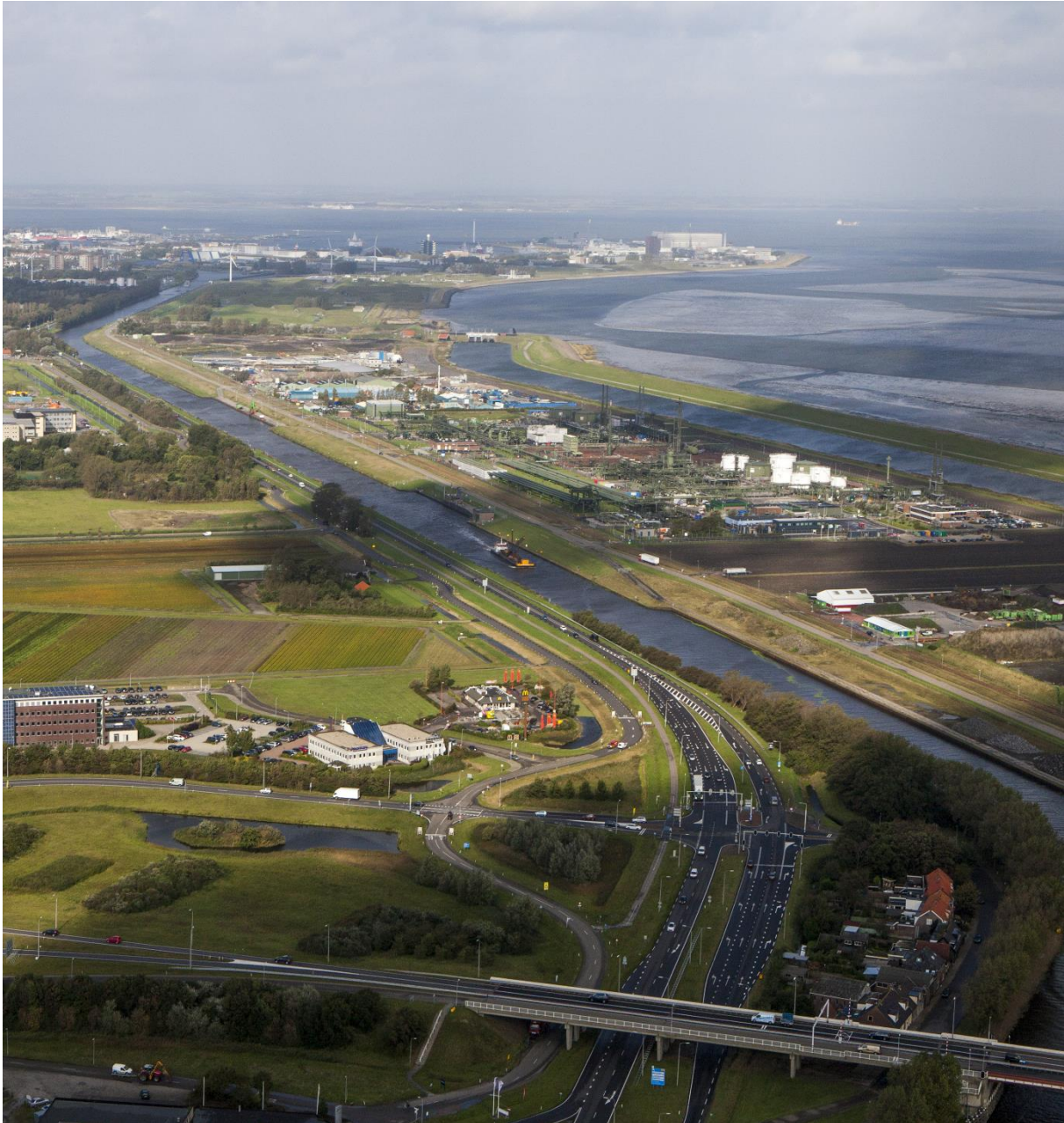
Afbeelding: een groot gedeelte van het Maritiem Cluster vanuit de lucht, met op de voorgrond Kooypunt, de N250 en bedrijventerrein Oostoever. Op de achtergrond zijn de contouren van de civiele- en Marinehaven te zien.

Het Maritiem Cluster omvat de oostrand van Den Helder, met grootschalige infrastructuur als de zeehaven (civiele haven en Marinehaven), de luchthaven (Den Helder Airport en militair vliegveld De Kooy), bedrijventerreinen Kooypunt en Oostoever en de N250. Het gebied speelt regionaal een belangrijke rol op verschillende gebieden, zoals economie en arbeidsmarkt, maritieme stadsontwikkeling, waterveiligheid, bereikbaarheid, natuur en cultureel erfgoed. Daarnaast speelt het nationaal een belangrijke rol als enige operationele vlootbasis voor de Koninklijke Marine.