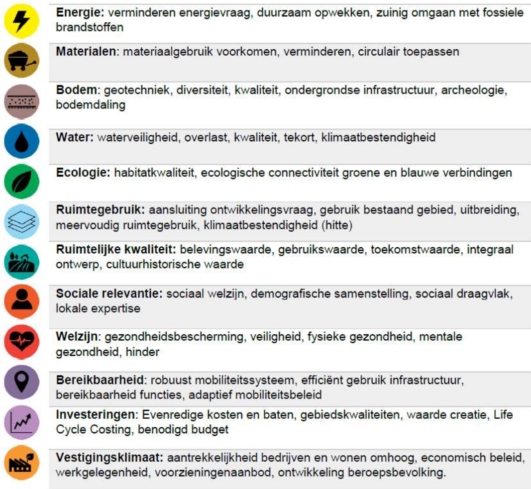
Figuur 3, thema's ambitieweb

Voordat de stappen uit de ambitiewebsessie worden doorlopen is het belangrijk om een gezamenlijk begrip te hebben van duurzaamheid. Duurzaamheid is niet geheel exact en berekenbaar. Om duurzaamheid concreet te maken, helpt het om het begrip af te bakenen. Dit zorgt ervoor dat de gemeente Roosendaal grip krijgt op het thema in de brede zin. Daarnaast helpt het om het thema binnen verschillende projecten te borgen, te vergelijken en te kwantificeren. De Aanpak Duurzaam GWW geeft een duidelijke structuur en indeling van duurzaamheid met behulp van twaalf thema's. Dit betreft de volgende thema's die we ook aanhouden in deze ambitiewebsessie: