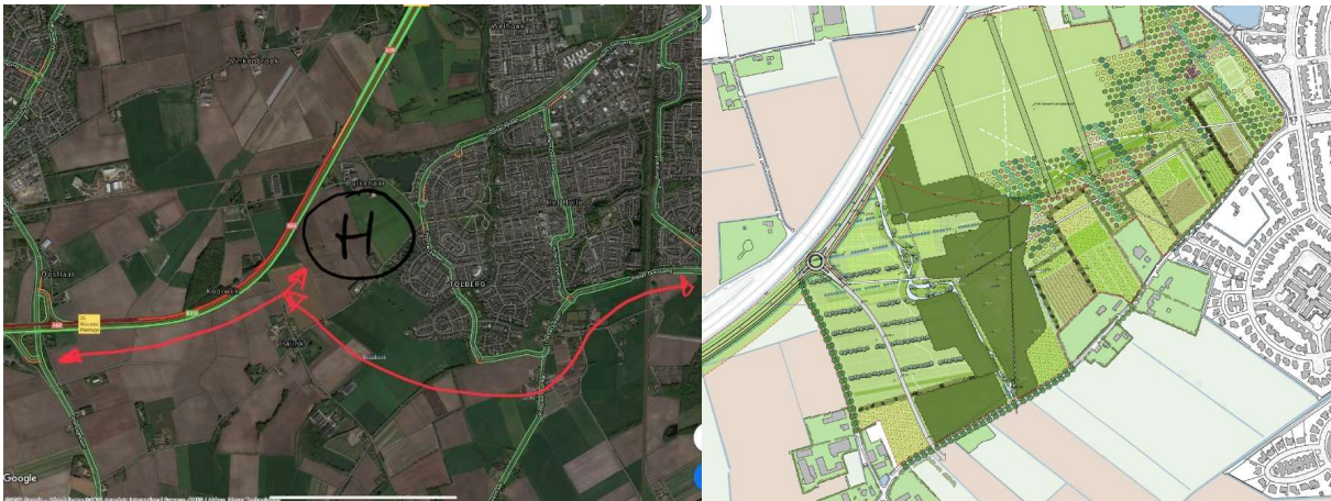
Figuur 1, luchtfoto projectgebied (in rood ontsluitingswegen) Figuur 2, inrichting landschapspark

De komst van het nieuwe Bravis ziekenhuis vormt de aanleiding om de Bulkenaar te ontwikkelen tot zorglandschap. Hieronder wordt een groen landschapspark verstaan met volop mogelijkheden om te recreëren en met daarin een gebied van ongeveer 12 hectare voor medische zorg. Behalve hoogwaardige zorg in de nabijheid ontstaan er voor de bewoners van de wijk Tolberg extra mogelijkheden om dichtbij huis te recreëren.