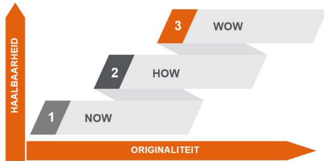
Figuur 4, NOW HOW WOW

Met behulp van een NOW/HOW/WOW-tabel zijn de geïntariseerde kansen en maatregelen verkend. Onderstaand figuur toont de definities van NOW, HOW en WOW. Deze onderverdeling helpt in het brainstormen over maatregelen die variëren in mate van haalbaarheid en originaliteit. Het geeft een indicatie van de inspanning, benodigd om de maatregel uit te kunnen voeren.