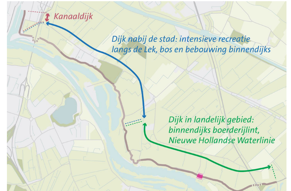
Kaart locatie deeltraject