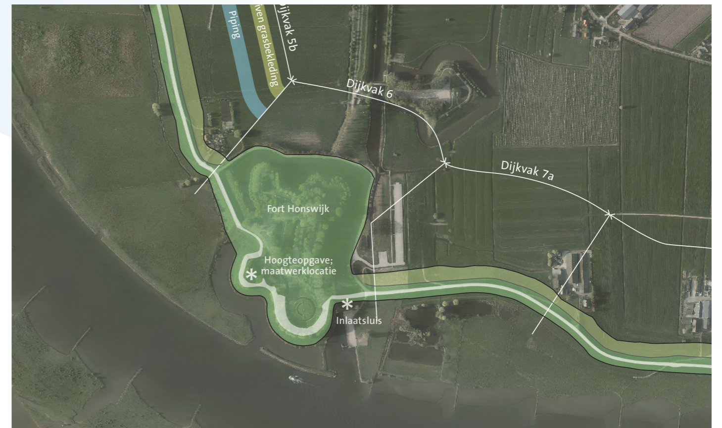
Kaart dijkvak en faalmechanismen

*voorlopige waterveiligheidsopgave maart 2021