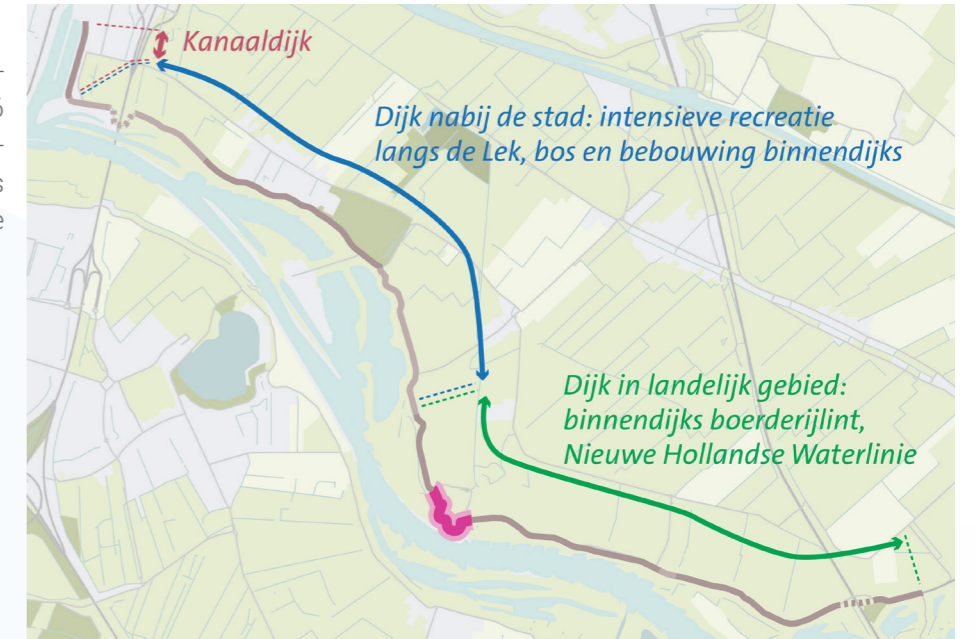
Kaart locatie deeltraject

Deeltraject 6 bestaat uit één dijkvak: 6