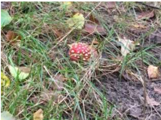
Afbeelding F63. Amanita muscaria