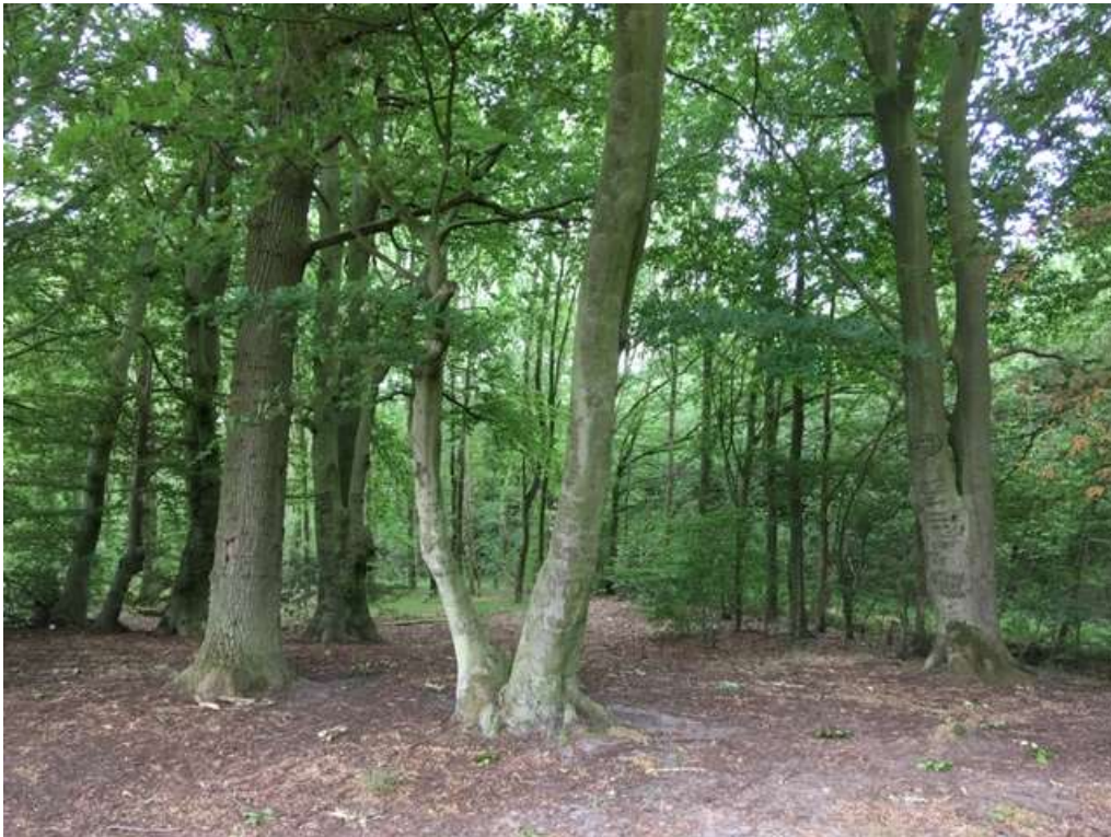
Afbeelding F62. Blankenskerkhof bij Veghel