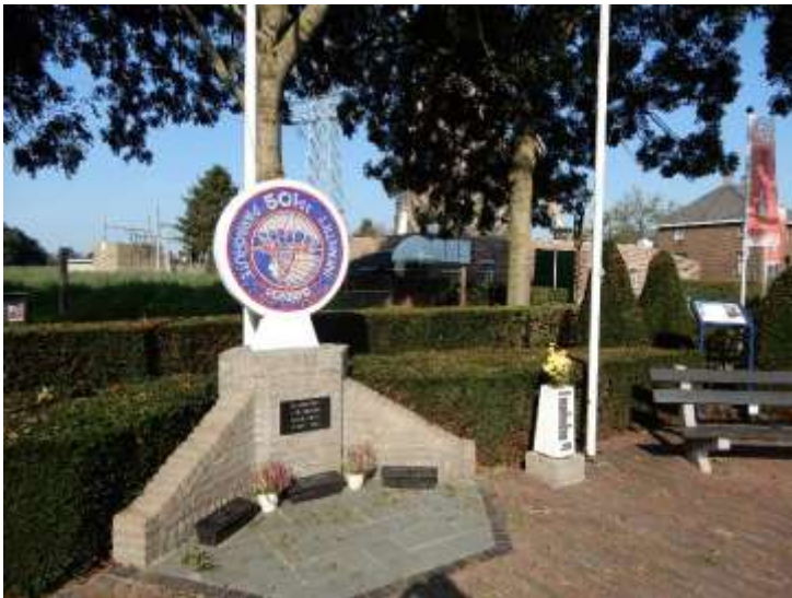
Afbeelding F98. Gedenkteken in Eerde