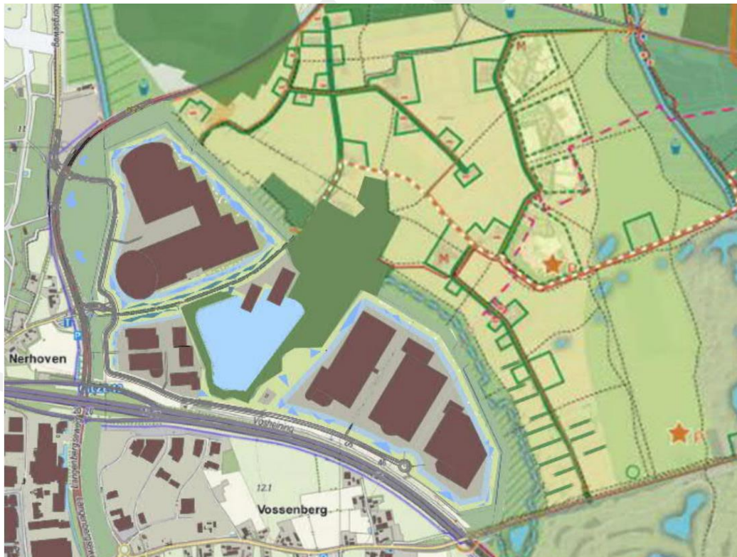
Figuur 1. Het voorkeursalternatief

De Commissie adviseert deze informatie in een aanvulling op het MER op te nemen, en dan pas een besluit te nemen over het bestemmingsplan. In hoofdstuk 2 licht de Commissie haar oordeel toe en geeft ze aandachtspunten voor het vervolgtraject.