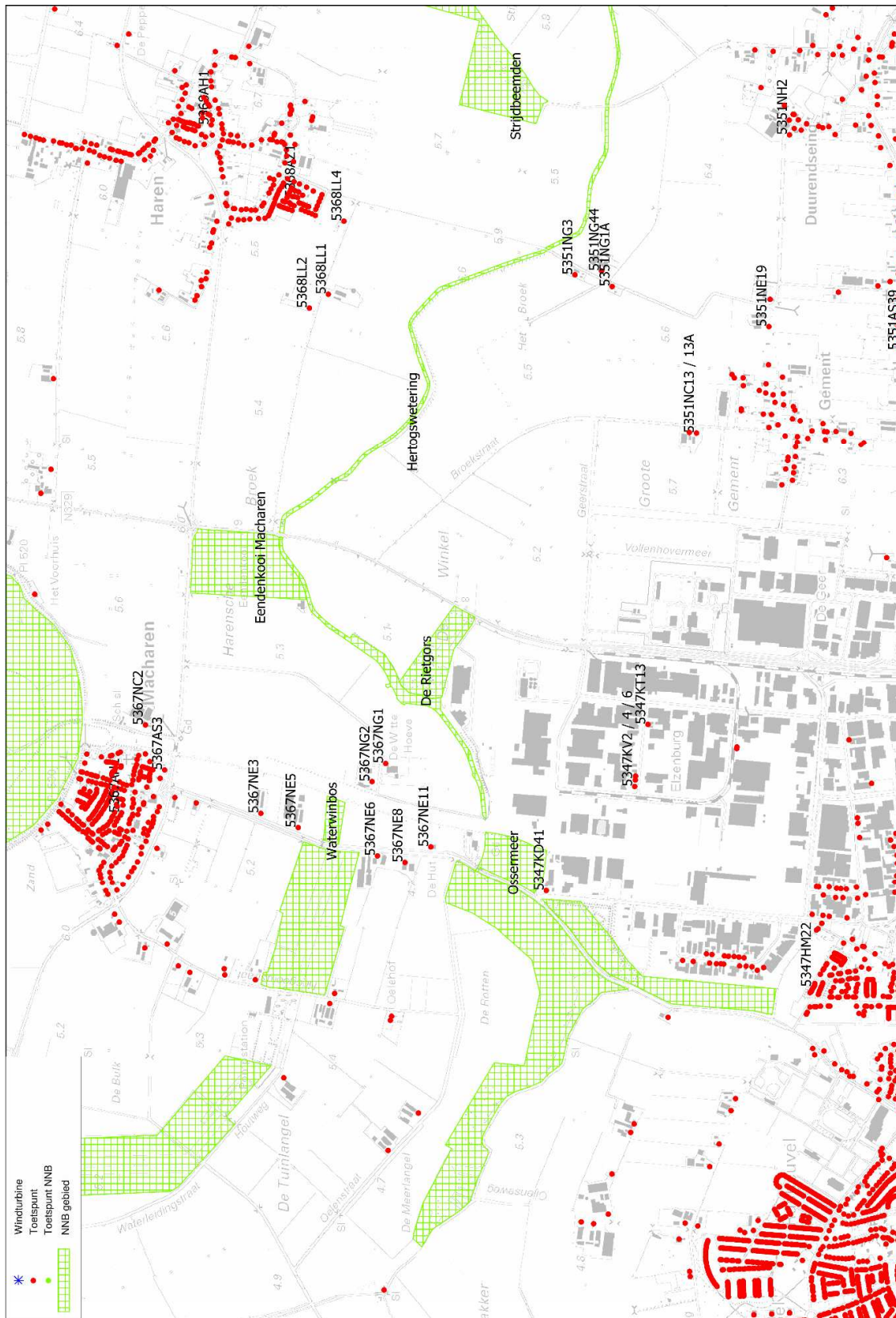
figuur 2 ligging van de ontvangerpunten