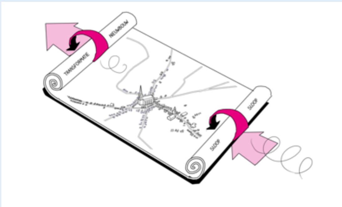
Figuur 1 Rollende voorraad

In het SVB borgen provincie en gemeenten de bovenregionale afstemming – indien gewenst via een woningmarktregio – met aandacht voor de kwaliteit, kwantiteit, doelgroepen, leefbaarheid en locatie van haar woningvoorraad. Streven is om vraag en aanbod in balans te houden. Voor de exacte invulling hiervan zal de regionale situatie steeds leidend zijn en samen met gemeenten nader worden uitgewerkt. Op basis van het beeld van de gemeentelijke opgaven kunnen we gezamenlijk met gemeenten op zoek naar de noodzakelijke instrumenten (lobby, fondsvorming, experimenteren, monitoring, etc.) om de woningvoorraad aan te passen aan de toekomstige behoefte.