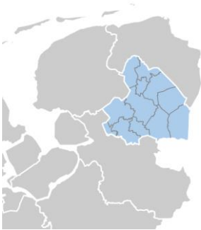
Afbeelding 3.1 Provincie Drenthe

De Omgevingsvisie Drenthe heeft betrekking op het hele grondgebied van de provincie Drenthe. Binnen de provincie liggen twaalf gemeentes. De provincie Drenthe grenst in het noorden aan de provincie Groningen, in het oosten aan de Duitse deelstaat Nedersaksen (landkreisen Emsland en Grafschaft Bentheim), in het zuiden aan de provincie Overijssel en in het westen aan de provincie Friesland.