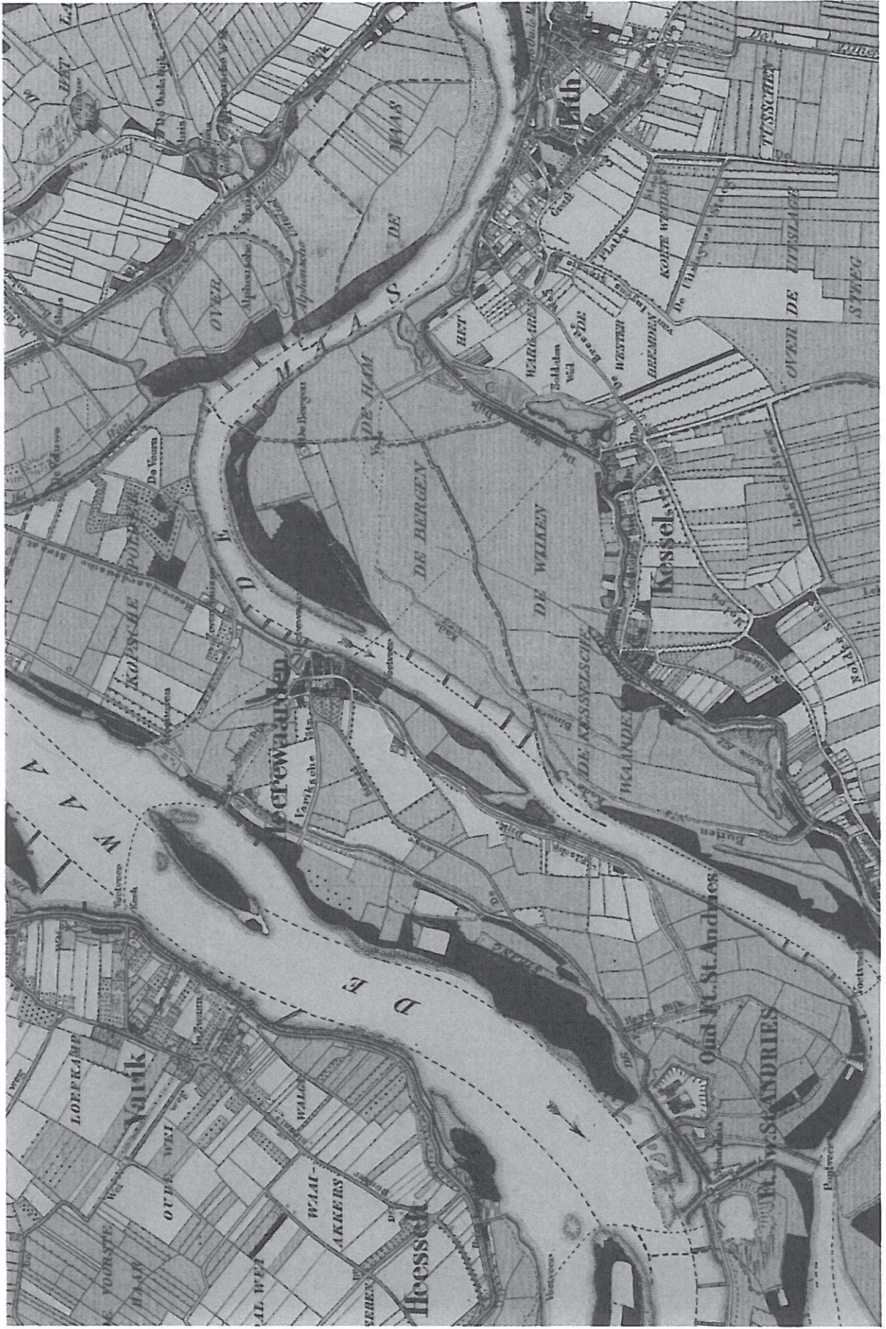
Kaart 1 Het eiland van Heerwaarden in 1872