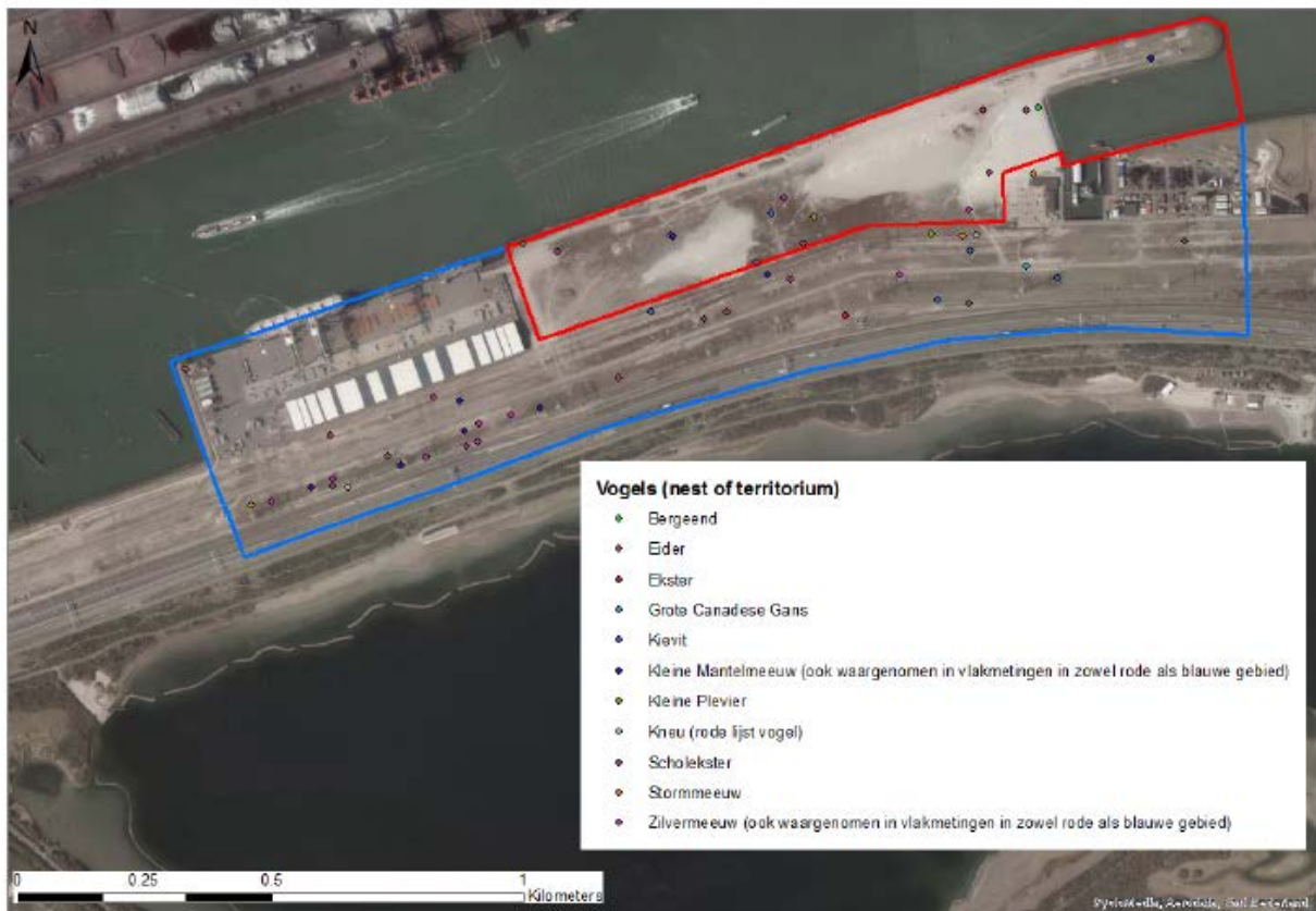
Figuur 2 Voorkomen vogelsoorten in plangebied en directe omgeving (bron Bureau Stadsnatuur)

STARO berekend het aantal territoria (onderstaand weergegeven) volgens: