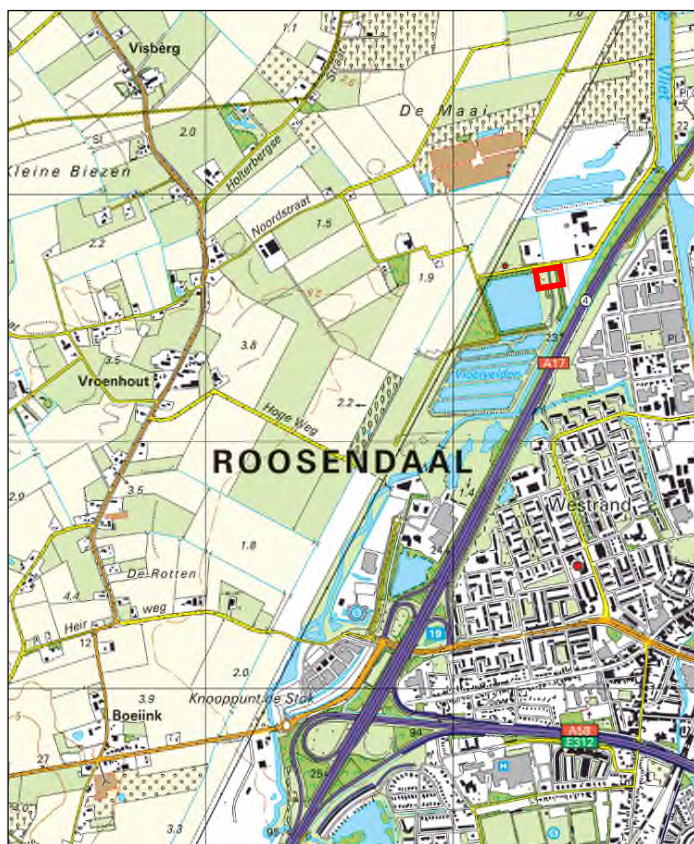
Figuur 1.1: Ligging van het plangebied