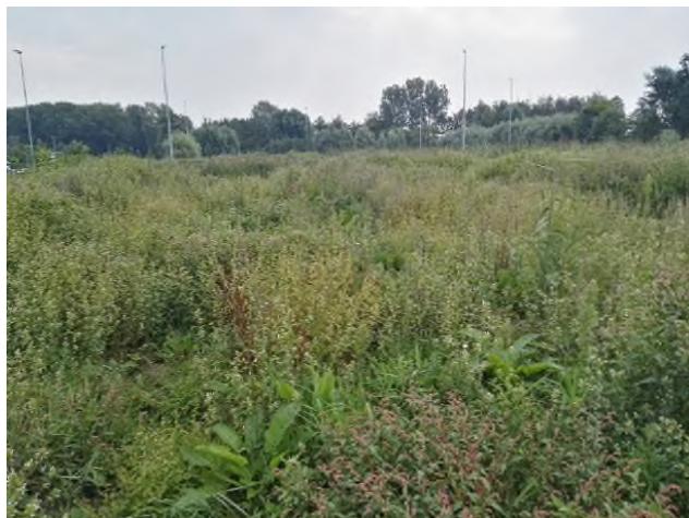
Figuur 4.4: Impressie biotoop plangebied: ruigtevegetatie.

Het oostelijke deel van de watergangen is volledig overgroeid met een rietvegetatie. Verder naar het westen heeft de watergang een open karakter. Het water in deze watergang wordt naar het retentiebekken gepompt.