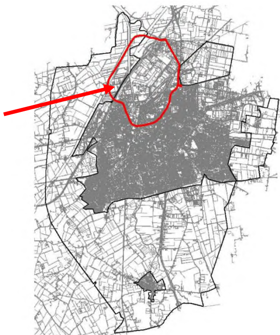
Figuur 4.2: Aanduiding zonegrens (met toegevoegde pijl voor situering locatie) (bron: Bestemmingsplan Buitengebied Roosendaal Nispen)

De locatie ligt binnen de zonegrens van het gezoneerde industrieterrein Borchwerf en Stationsgebied, maar maakt zelf geen deel uit van dit gezoneerd industrieterrein. De desbetreffende geluidzone is opgenomen in het Bestemmingsplan Buitengebied Roosendaal Nispen.