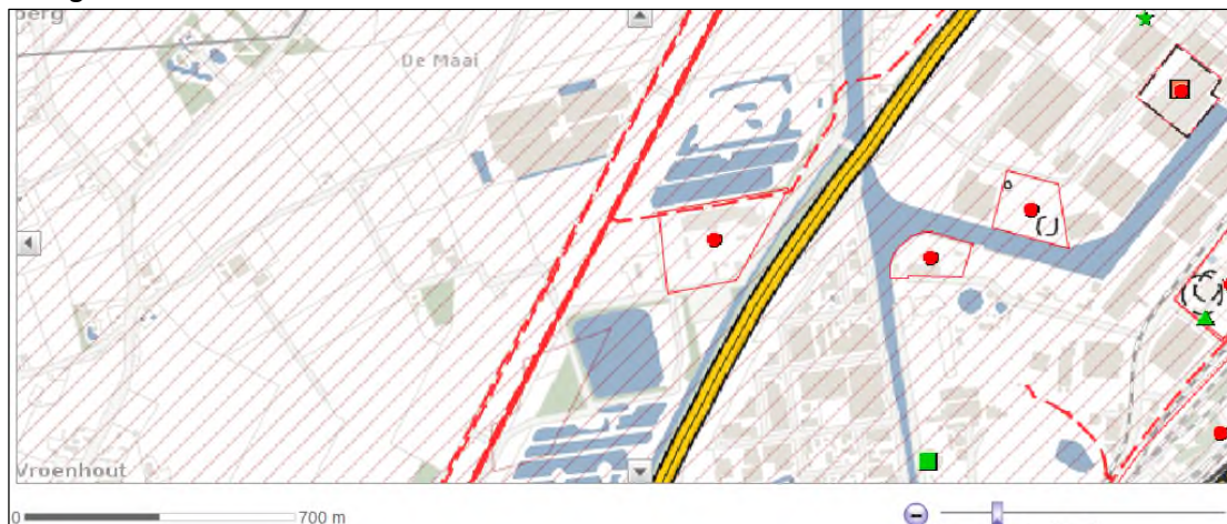
Figuur 4.3: Uitsnede risicokaart

Uit de risicokaart (risicokaart.nl) is de volgende informatie af te leiden.