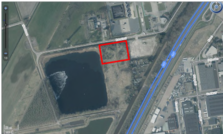
Figuur 3.1: Locatie

De locatie van de voorgenomen activiteit is weergegeven in figuur 3.1.