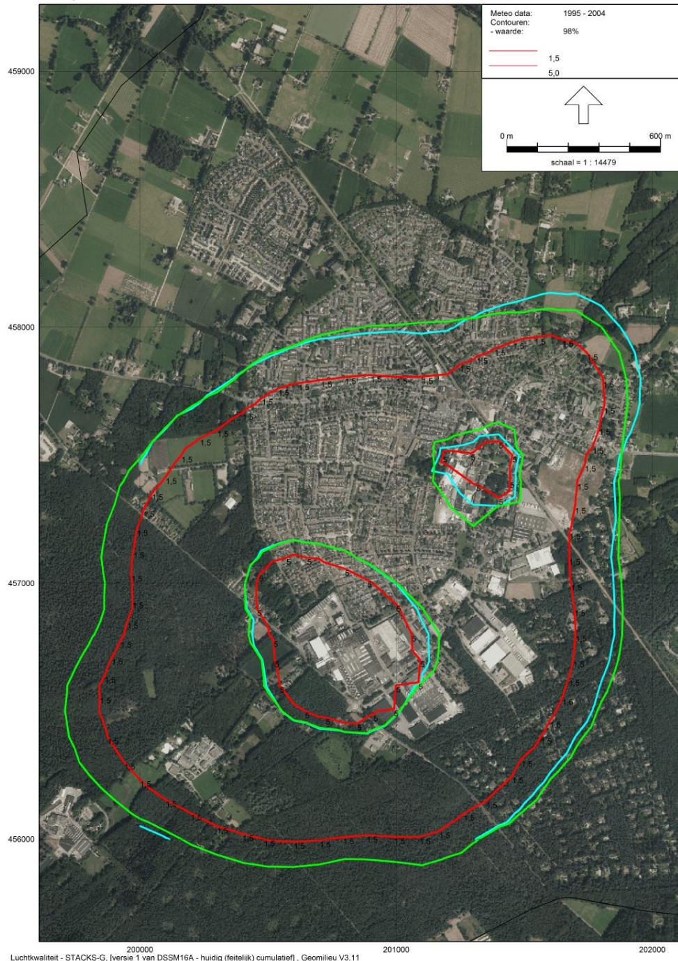
Figuur c: Geurcontouren van 1,5 en 5 ou_E/m^3 als 98-percentielwaarde als gevolg van DSS en MM in de vergunde situatie (groen), de vergunde situatie op basis van recht evenredige extrapolatie van de in 2015 bij MM gemeten waarden (lichtblauw), en de actuele 'best-case' situatie (rood).

Figuur c geeft de situatie weer waarin het verschil tussen de actuele en vergunde geurbelasting maximaal is. De geurbelasting in de werkelijke actuele situatie zal hoger zijn dan in figuur c is weergegeven met de rode contouren. De actuele geuremissie van DSS is namelijk onderschat . De